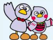
埼玉県のマスコット 「コバトン」「さいたまっち」

※ 交付決定後に対象となる取組を実施し、就業規則の作成又は改正を行う場合が対象となります。